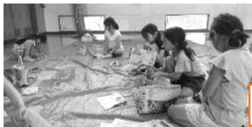
新聞紙バッグ作り

ハロウィン祭り 仮装をしたり、ハロウィン にちなんだゲームや工作で 気分を盛り上げます