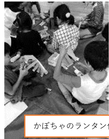
かぼちゃのランタン作り