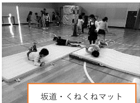
坂道・くねくねマット