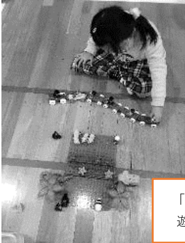
「レゴブロック」 遊び方は無限大!