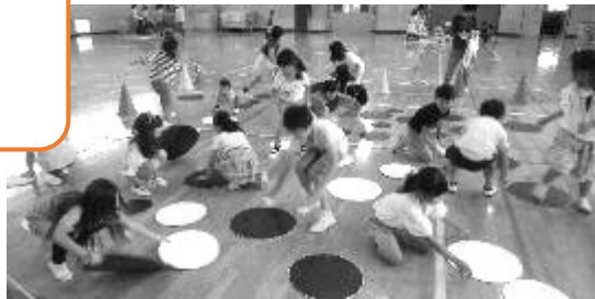
ビッグオセロ返し