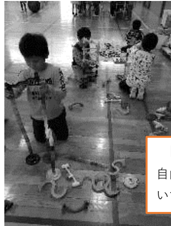
「ビー玉転がし」 自由にパイプをつな いで・・・

他にもけん玉やコマ回しなどの懐かしいおもちゃ、工作上手なパートナー手作りのパズル、ゲーム、お絵描きや手芸の用具、バランスボールなどなどたくさんの遊具が揃っています。大縄跳びやバドミントンも大人気です♪