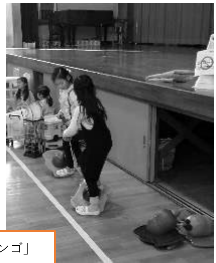
「ゾインゴボインゴ」 ボール型のホッピング

他にもけん玉やコマ回しなどの懐かしいおもちゃ、工作上手なパートナー手作りのパズル、ゲーム、お絵描きや手芸の用具、バランスボールなどなどたくさんの遊具が揃っています。大縄跳びやバドミントンも大人気です♪