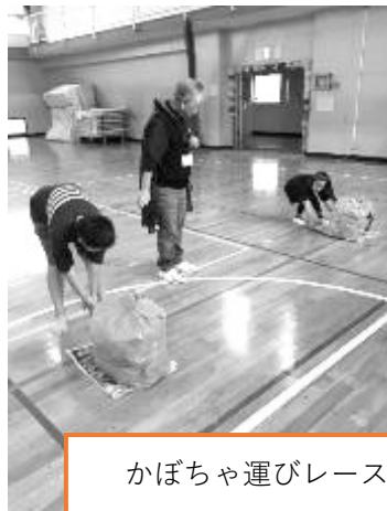
かぼちゃ運びレース