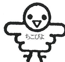
茅ヶ崎市子ども会連絡協議会 ロゴマーク