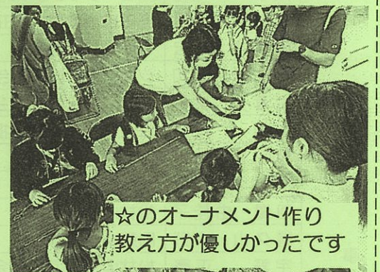
☆のオーナメント作り 教え方が良かったです