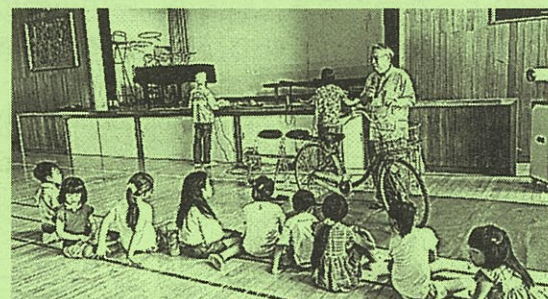
自転車の正しい乗り方など教わりました