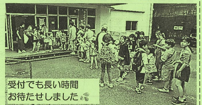
受付でも長い時間 お待たせしました。