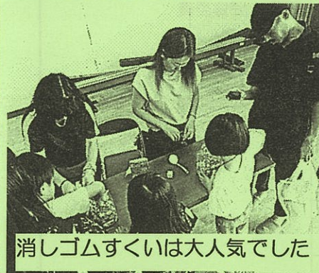
消しゴムすくいは大人気でした