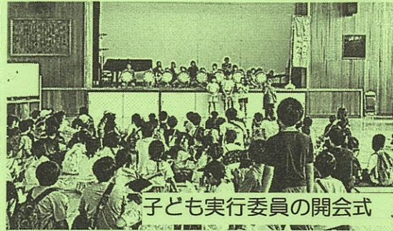
子ども実行委員の開会式

梅雨の中の朝まで弱く降る雨でしたが、想定を超える477名の参加をいただきました。子ども実行委員の開会式から始まり、室田お囃子保存会の方々の太鼓演奏を聞いて、各ブースが始まりました。参加した子どもたちから「楽しかった！」「宝探しは簡単だったよ！」などの感想を聞けました。