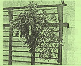
みなさんの 願い事が叶いますように！