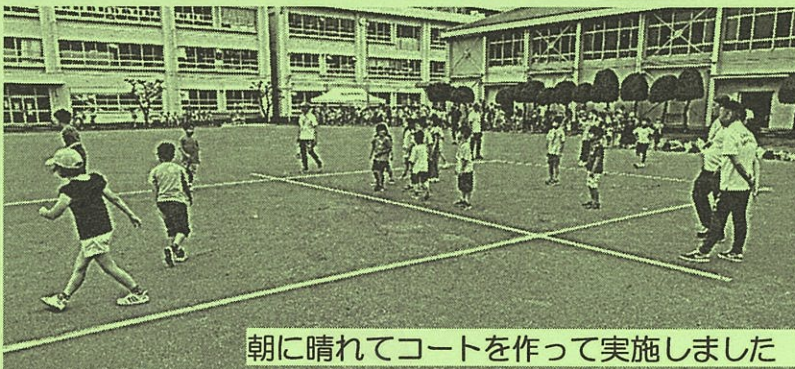
朝に晴れてコートを作って実施しました