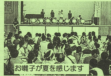
お囃子が夏を感じます