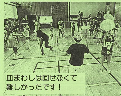
皿まわしは回せなくて 難しかったです！