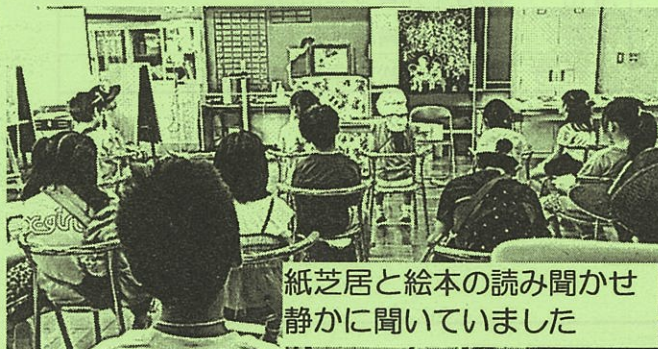
紙芝居と絵本の読み聞かせ 静かに聞いていました