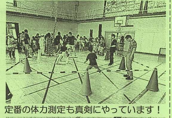
定番の体力測定も真剣にやっています！