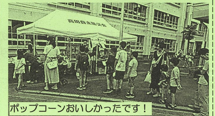
ポップコーンおいしかったです！