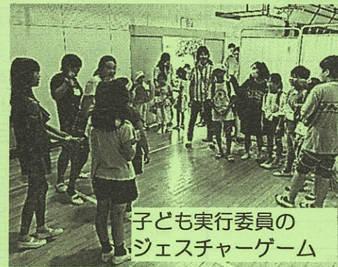
子ども実行委員の ジェスチャーゲーム