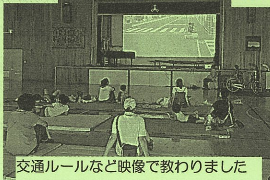
交通ルールなど映像で教わりました