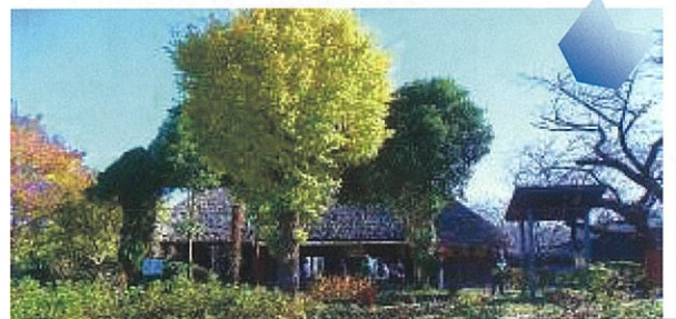
旧和田家住宅では、中に入り農家の暮らしの様子を教わりました