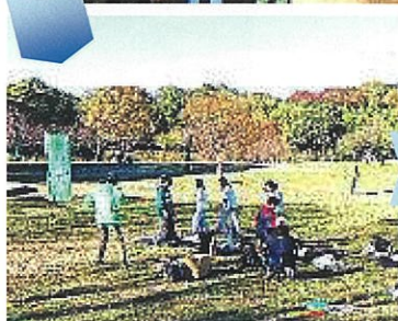
子どもたちは食べ終わると…