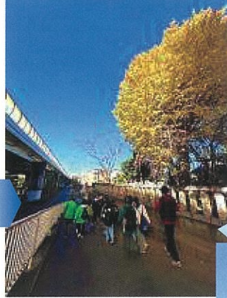
秋なので神明大神の横は、イチョウの葉がきれいに色づいていました