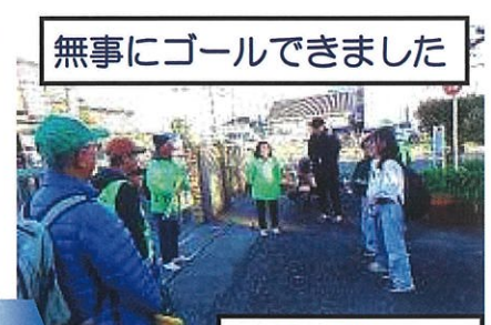
無事にゴールできました