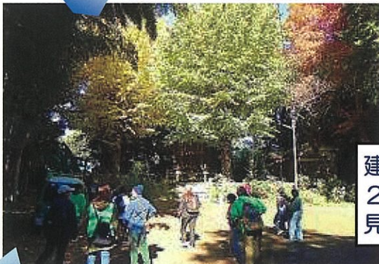
建彦神社では、2本のイチョウの木の葉の色が違い見事なグラデーションになっていました