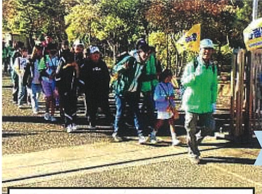
元気に正門から出発しました

県立茅ヶ崎里山公園まで児童 10 名と保護者の方2名と先生1名を含む総勢25名で歩いて往復できました。好天の中でスタートして、茅ヶ崎市博物館に寄って説明を聞き、公園内でお昼ご飯を食べて遊んできました。途中解散したので学校まで戻った児童は3人と少なかったですが、みなさんリタイヤせずに歩き切りました。秋なので紅葉が各所で見られてきれいでした。