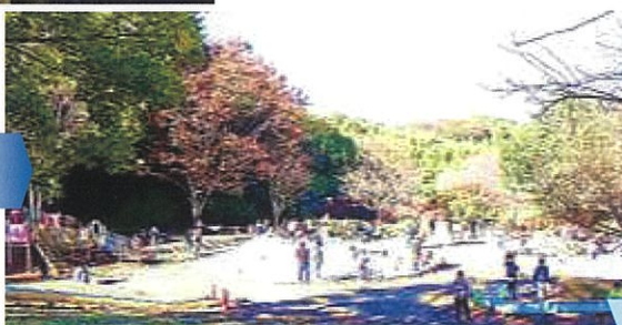
遊具で、ずーっと遊んでいました