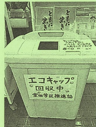
エコキャップ回収