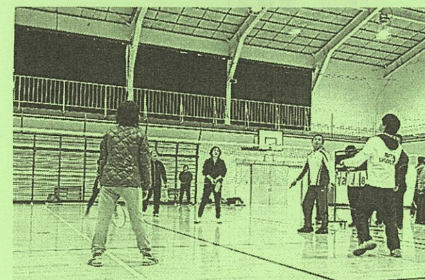
学区内スポーツ交流会