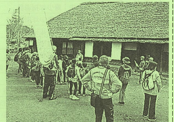
あるけ！あるけ！里山公園へ

各事業・会議等は、新型コロナウイルス感染状況により、変更や中止とする場合があります。感染対策など徹底して活動進めていきますので、今年度も、ご協力をよろしくお願いいたします。