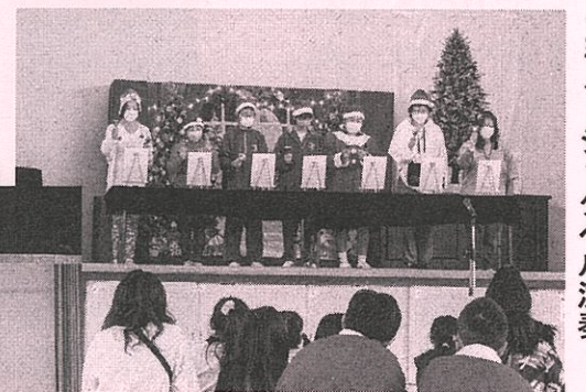
ミュージックベル演奏