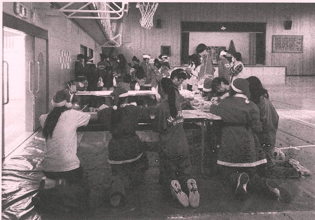
12月16日(土) クリスマス会