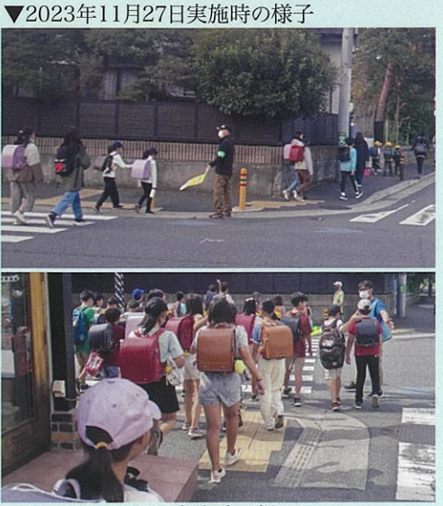
▲2023年6月26日実施時の様子