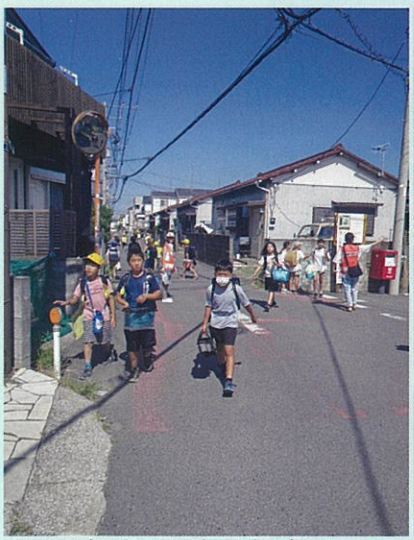
▲2023年7月12日実施時の様子

2023年6/26、7/12、9/25、11/27、2024年1/15、3/11の合計6回、自治会、民生委員児童委員協議会、浜小PTAのご協力をいただき、下校の見守り活動を行いました。1月のパトロールの際、「車のミラーと飛び出してきた子どもの腕が当たる接触事故」があったと青柳校長先生よりご報告がありました。車が減速していたおかげで幸い大きな事故にはならなかったとのことですが、子どもたちの事故に対する危機意識を改めて感じてもらうとパトロール中の声かけを積極的に行いました。パトロール後の反省会では、「どの箇所でも自転車や車に対する恐怖心を感じていない子どもたちが多く、注意喚起や危険だということを学ぶ場がもっと必要だと感じた。」というご意見もいただきました。