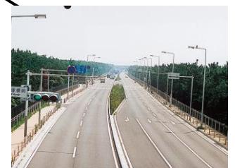
なかかいがん ⑩ 国道134号 (中海岸)