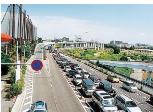
さんぎょうどうろ しん ⑦ 産業道路・新湘南バイパス (柳島)