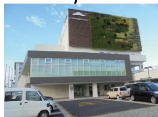
はまみ だいら ⑧ ハマミーナ (浜見平)