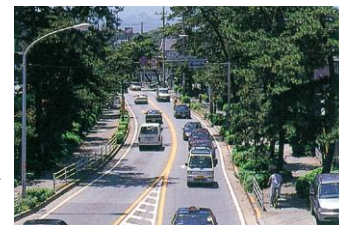
こくどう ごうほんそん ⑫ 国道1号 (本村)