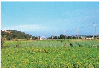
たはた あかばね ⑬ 田畑の多い所 (赤羽根)