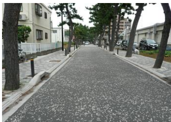
つるみねはちまんぐう さんどう はまのごう ④ 鶴嶺八幡宮の参道 (浜之郷)