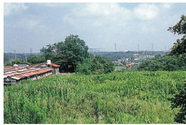
みどり おお ところ せりざわ ② 緑の多い所 (芹沢)