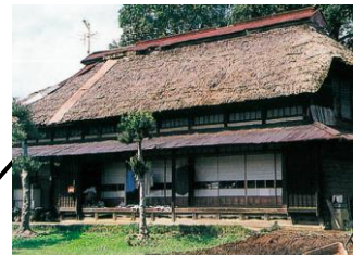
むかし いえ ③ 昔のつくりの家