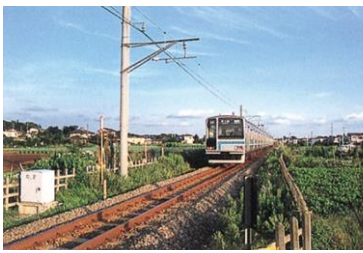
さがみせん ① 相模線