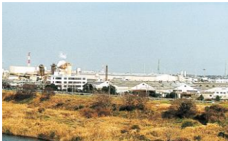
こうじょう はぎその ⑤ 工場がある所 (萩園)