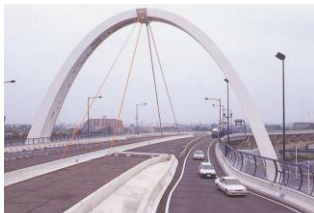
しょうなん やなぎしま ⑥ 湘南ベルブリッジ (柳島)