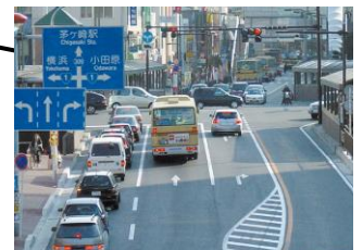
えきまえ ⑪ 茅ヶ崎駅前