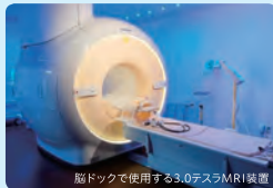
脳ドックで使用する3.0テスラMRI装置