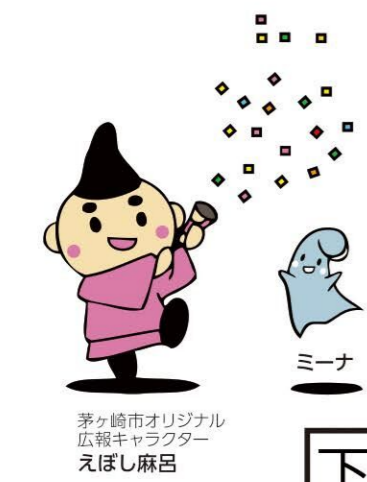
茅ヶ崎市オリジナル 広報キャラクター えぼし麻呂