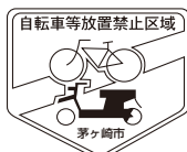
Un cartel de No Estacionar para bicicletas

Los alrededores de la Estación de Chigasaki son una zona designada como no apta para estacionar bicicletas, etc.