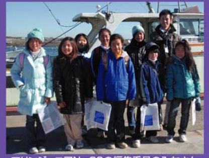
マリンジュニアNo.30の編集委員のみなさん