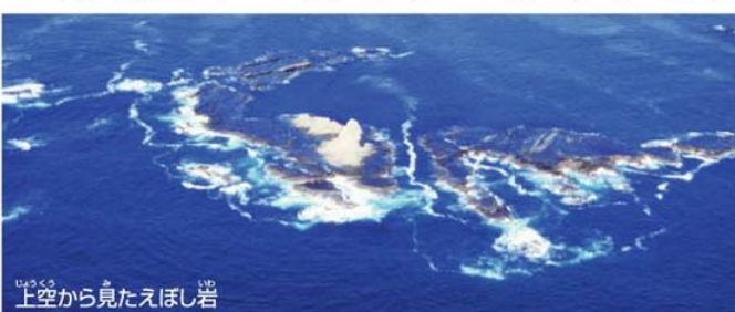
上空から見たえぼし岩

いた古い記録から、えぼし岩は茅ヶ崎のものだと決着がつきました。今もアジやサバ、イサキ、イナダなどが捕れ、「小鯖島」や「大鯖島」など魚の名前がついた島があります。