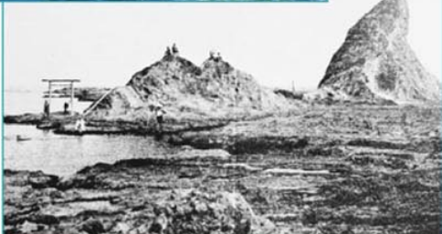
昭和初期のえぼし岩