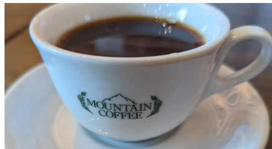
マウンテンコーヒー 様