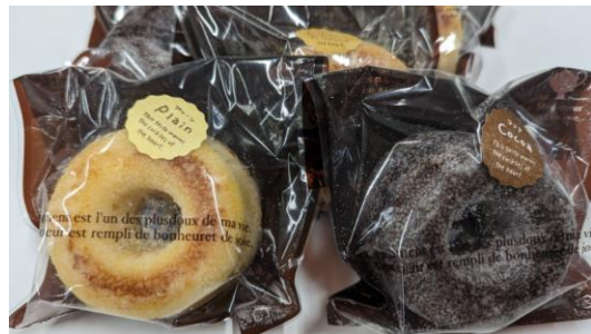
フィーユ・ダンジュ 様