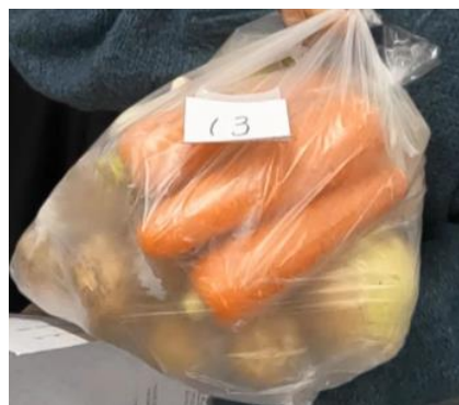
(カレーセット) 青果ことぶき 様