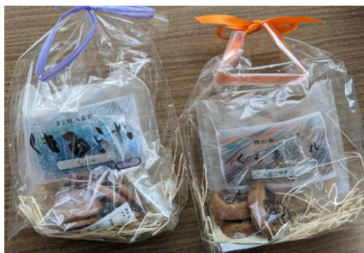
社会福祉法人 翔の会 様