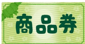
エスパティオ小和田店 様