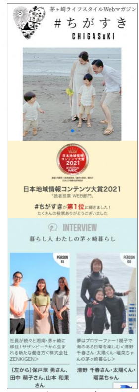
#ちがすきトップページ