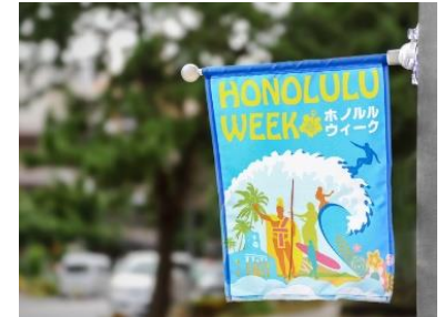
ホノルルウィークオリジナルフラッグ