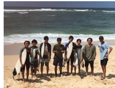
ハワイサーフィン協会との交流