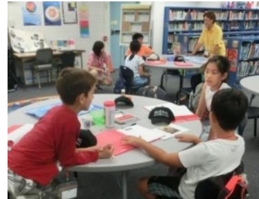
青少年交流事業派遣先でのグループワーク