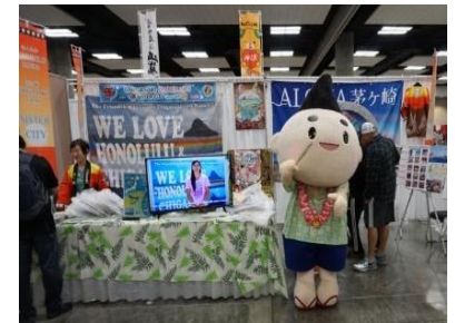
ホノルルフェスティバル出展ブース