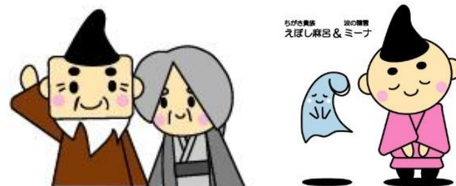
ちがき興産 協賛 えぼし麻呂&ミーナ