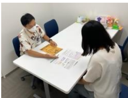
▲ 相談ブース(画像はイメージです)