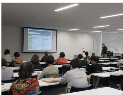
▲ 認知症サポーター養成講座 ▲