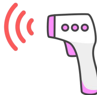
非接触型体温計による検温