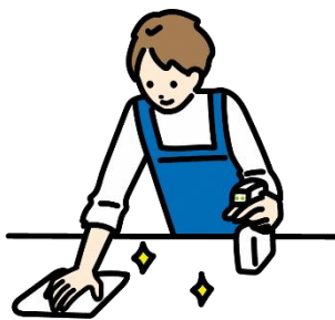
共有物の消毒の徹底