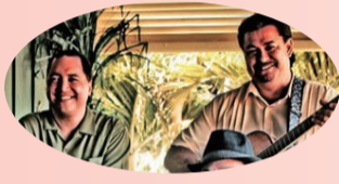
ザナック&キモ (カハラ)