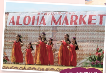
ハワイを感じるステージにも注目