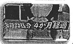
本日仕込み 4か月经過

調味料シリーズ第3弾！大豆を煮る手間なし。材料を混ぜるだけでお味噌が完成します。是非おから味噌づくりに挑戦して下さい。