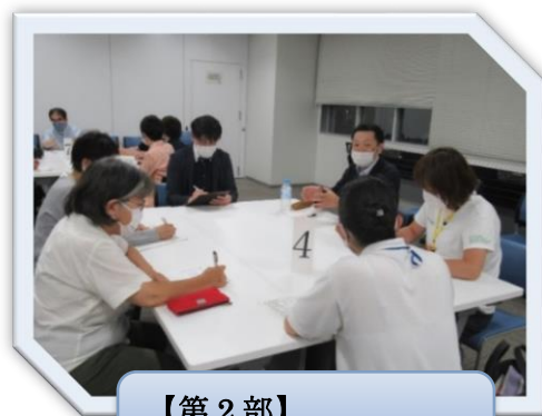
【第2部】 グループワークの様子

【第2部】のグループワークでは、具体的な現状の共有を行い、普段は見えない他職種の現状を知る機会となりました。