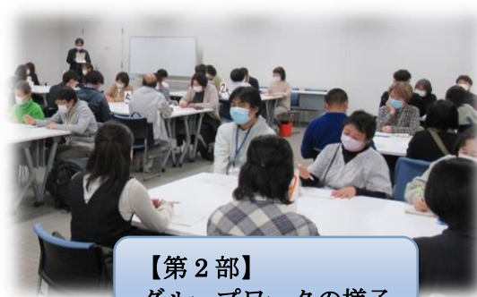
【第2部】 グループワークの様子

【第2部】のグループワークでは、コロナ禍苦慮したことなどを共有した。また、今回の経験を踏まえ、BCP作成の必要性を主張する声も聞かれた。