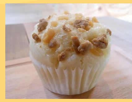
蒸しパン 中華風肉みそ(200円)