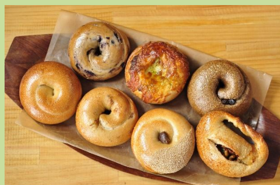
ベーグル もちもちプレーン(270円~)

イベント出店では即完売!!茅ヶ崎生まれのベーグル専門店。国産小麦を使用、卵・バター・牛乳は不使用で素材にこだわった、もちもちと歯応えのあるベーグルです。当日は、ベーグル18種、スコーン2種をご用意しています。