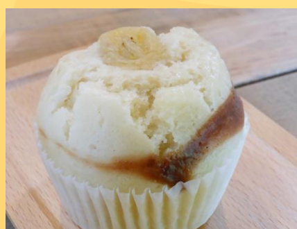
蒸しパン チョコバナナ(200円)

天然酵母と国産小麦を使ったむっちりモチモチ食感の蒸しパンを毎日丁寧に作っています。今までの蒸しパンに対するイメージガラッと変わるといえます。甘い系からおかず系まで、生地ぴったりな味付けの具材が中にたっぷり入っています。