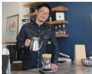
1杯1杯丁寧にドリップ

障害のある方々が暮らしやすいまちづくりを目指して「第5期茅ヶ崎市障害者保健福祉計画(素案)」(平成30年度~平成32年度)をとりまとめました。 期間 11月24日(金)~12月26日(火) 公表 2018年3月(予定) 応募 郵送(〒253-8686茅ヶ崎市役所障害福祉課)、☎(82)5157、資料配布場所、市団で 問合せ 障害福祉課障害福祉推進担当