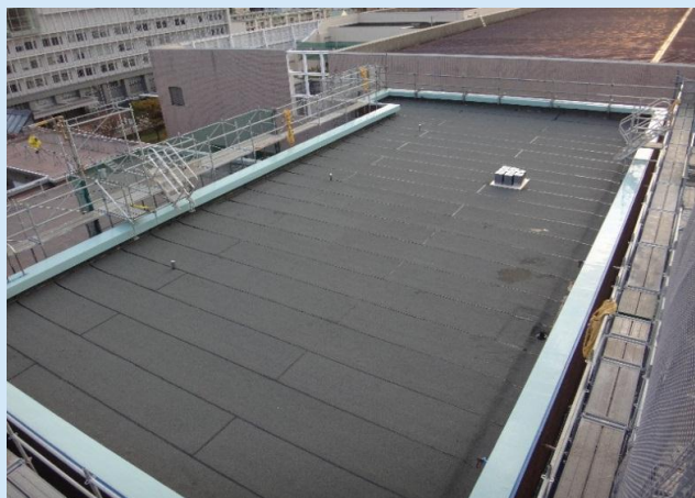
屋上アスファルト防水施工