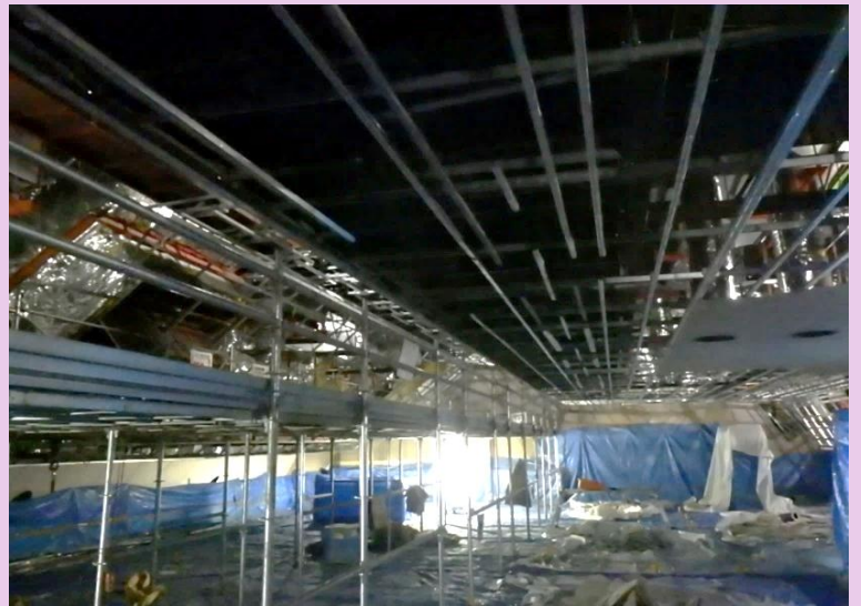
大ホール天井解体

基礎工事では、耐震のため、地中の基礎コンクリートを増し打ちして補強する工事を行っています。耐震補強を行うことでいままでもより地震に強く、これからも末長く市民のみなさまに使用していただける建物になります。