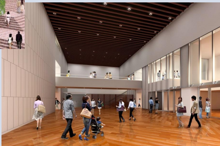
2階ロビーイメージ図

館内の段差を解消するバリアフリーの工事や多機能トイレを増やす改修、ホールの座席を3cm広げる改修、また、小規模の展示会も催せる展示室の改修など工事の進捗をこのニュースレターで伝えていきます。