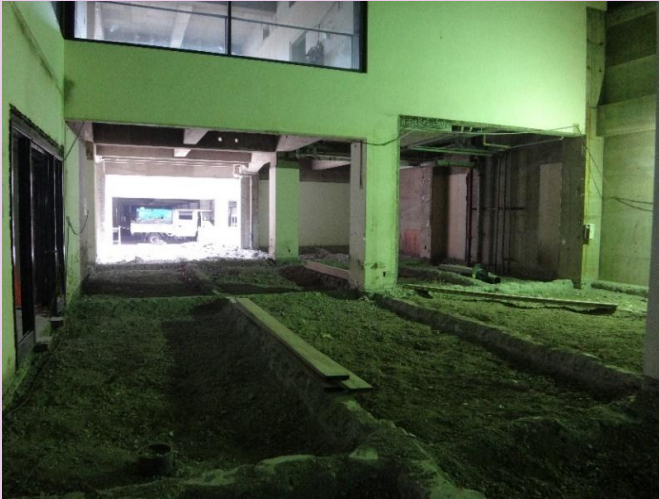
展示室床躯体解体