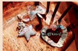
座席シートを使用した オーナメント