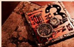
館内の看板を使った 時計・温度計