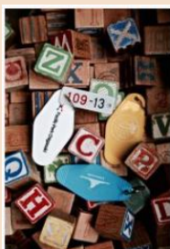
座席プレートを使用した キーホルダー