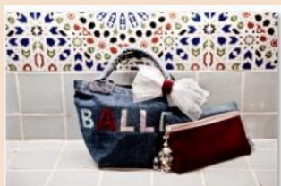
座席シートを使用した バッグとポーチ