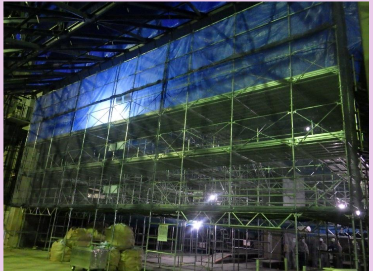
大ホール足場組立

内部、外部ともに耐震補強前の解体工事を行っています。また、耐震補強工事の一つである杭工事を開始しました。この杭工事は、非常に特殊な機械を使って施工しており、耐震補強ならではの工法です。