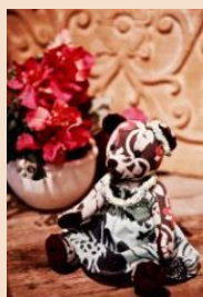
座席シートとブランド オリジナルテキストスタイルを 使用したぬいぐるみ