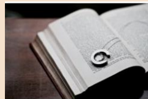
映写機のレンズとチタンを使用した 茅ヶ崎サザンCモチーフのネックレス

新たな文化会館の幕明けに先立って、37年の歴史が刻まれた「文化会館のカケラ」が、湘南茅ヶ崎を愛するアーティストたちのぬくもり溢れる手のなかで、茅ヶ崎を感じるメモリアルグッズとして生まれ変わります。この事業は、改修工事による文化会館の再生と、改修工事で使われなくなった資源(=「文化会館のカケラ」)の再利用という双方の取り組みが、今ある文化の継承と環境への配慮につながることから、市内事業者とともに実施することになりました。