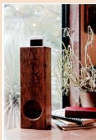
舞台用品を使用した スマートフォン用スピーカー