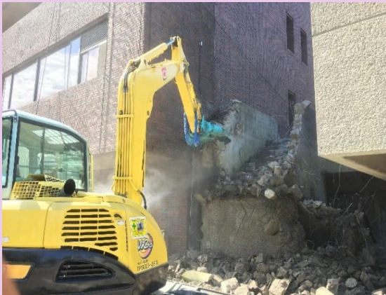
外部階段躯体解体