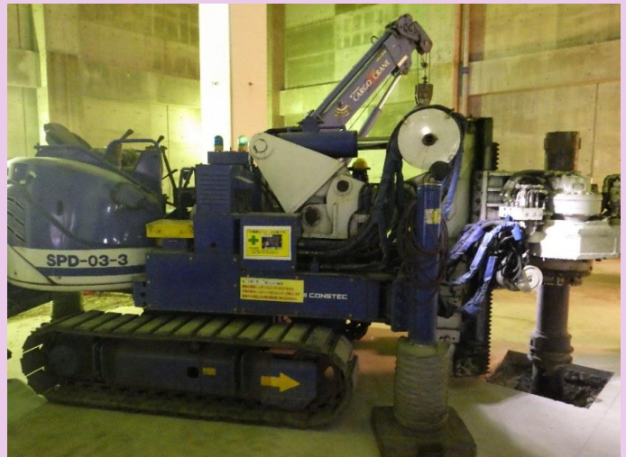
1階展示室杭打ち工事