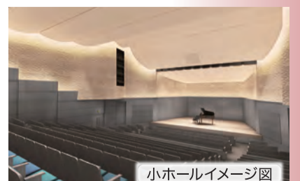
小ホールイメージ図