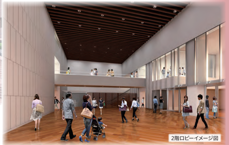
2階ロビーイメージ図