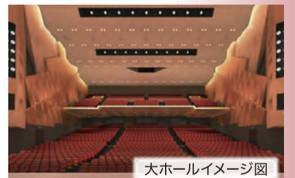
大ホールイメージ図