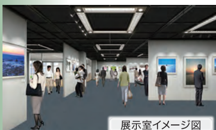
展示室イメージ図