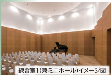
練習室1(兼ミニホール)イメージ図