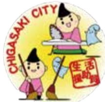
市の研修を修了した生活援助員などがつけるバッジ