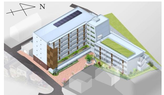
(南東側からのイメージ)

階数 (西棟) 地上6階、(東棟) 地上3階 用途 市営住宅(50戸) (1DK22戸、2DK18戸、3DK10戸) 児童クラブ 地域包括支援センター 地区社会福祉協議会地区ボランティアセンター 床面積 約3,800㎡