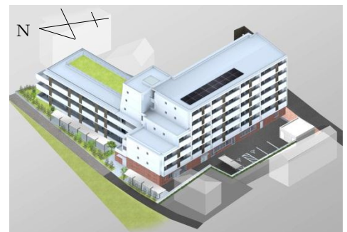
(北西側からのイメージ)

所在地番 小和田三丁目401番3ほか 敷地面積 約2,300㎡ 用途地域 準工業地域、第1種住居地域(準防火地域) 建ぺい率 60% 容積率 200% 高さ制限 第3種高度地区(20m) 第4種高度地区(31m)