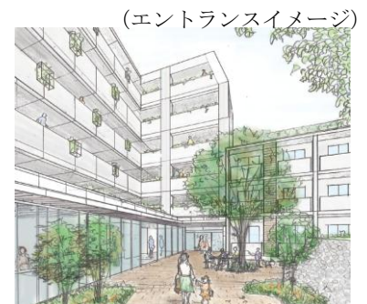
(エントランスイメージ)

所在地番 小和田三丁目401番3ほか 敷地面積 約2,300㎡ 用途地域 準工業地域、第1種住居地域(準防火地域) 建ぺい率 60% 容積率 200% 高さ制限 第3種高度地区(20m) 第4種高度地区(31m)