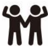
協働 = 協力して行動

「市民活動を行うものと市」による「協働」、 「市民と事業者」による「協働」、 「市民活動を行うものと事業者」による「協働」など組み合わせは様々ですが、共通の目的を達成するための手法の一つです。