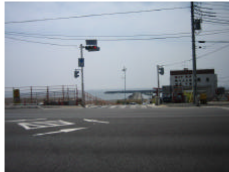
写真) 国道 134 号沿道の景観