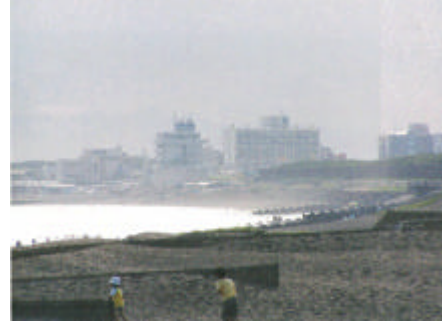
写真) B 地区方向の眺望