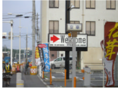
写真) 国道沿いの B 地区の景観 (左) と商業施設の看板 (右)