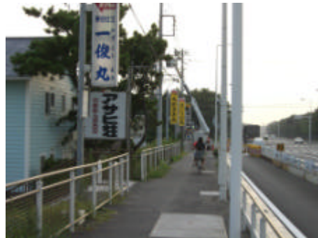
写真) 国道から見た A 地区の景観(左)と歩道に並ぶ看板(右)