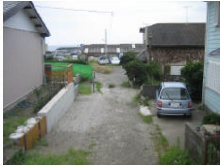
写真) A 地区内部の様子