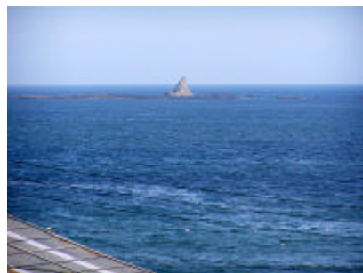
写真) 海岸から望む遠景