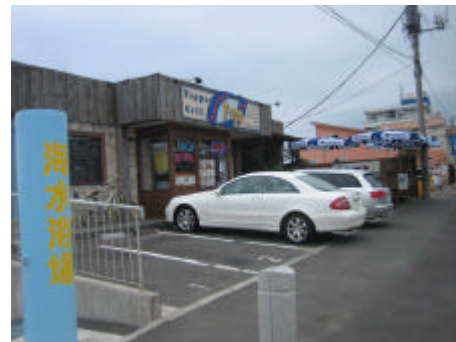
写真) 国道沿いに立地する住宅や店舗