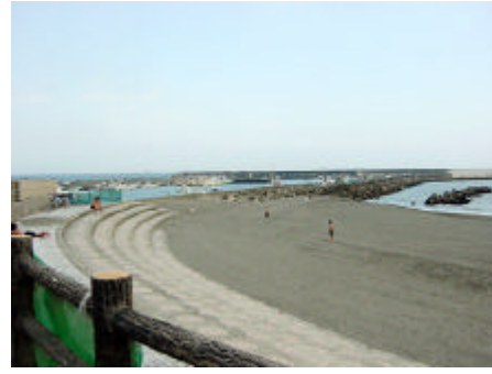
写真) お祭り広場(左)とお祭り広場から海岸への景観(右)