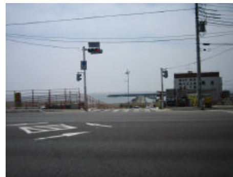
写真) 国道 134 号沿道の景観