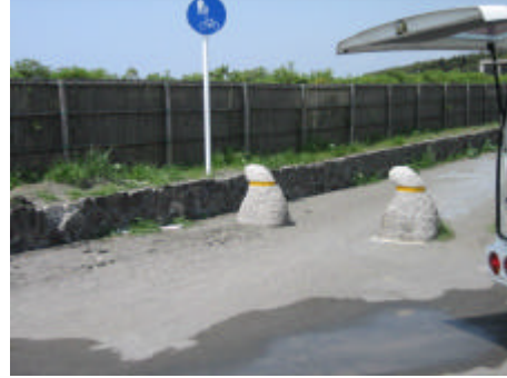
写真) サイクリング道路