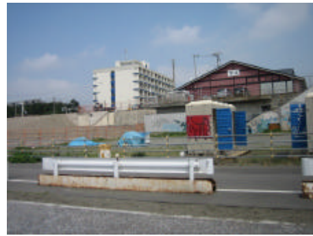
写真) A、B 地区を望む景観