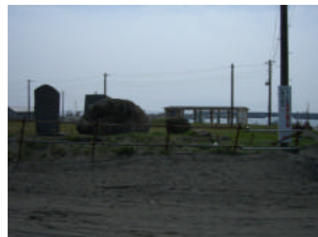
写真) 漁港施設と周辺の状況