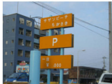
写真) サザンビーチちがさき駐車場(左)と案内表示(右)