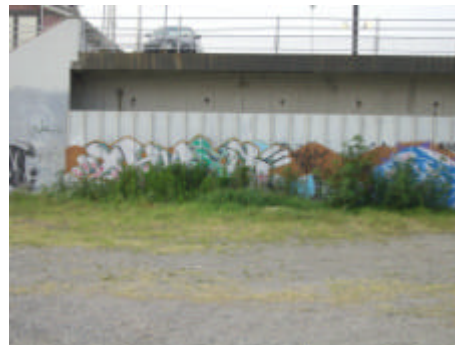
写真) 宿泊施設の正面 (左) と海岸から見た擁壁部分の落書き (右)