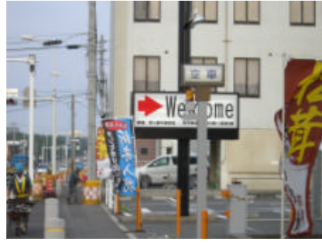
写真) 国道沿いの B 地区の景観 (左) と商業施設の看板 (右)