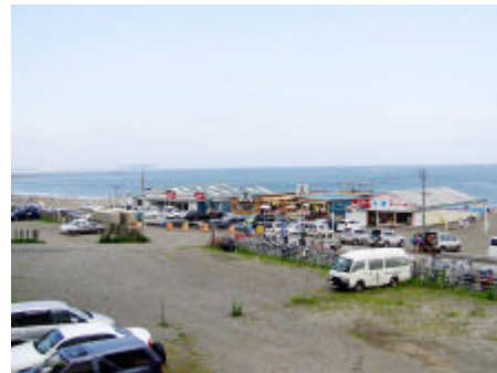
写真) 海浜地区内部の景観（右は海水浴シーズンの様子）