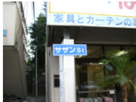
写真) 国道 134 号後背地 (左) とアクセス道路に設置されたサイン (右)