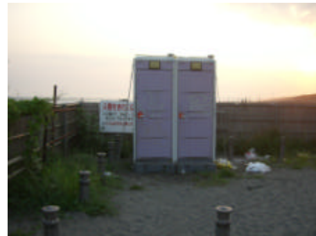
写真) 防波堤(左)と簡易トイレ(右)