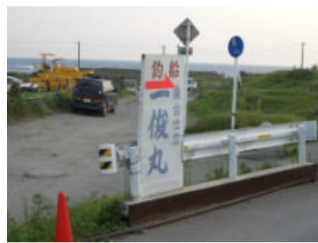
写真) A 地区内の漁業関連施設(左)と地区内にある看板(右)