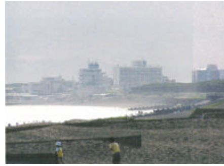
写真) B 地区方向の眺望