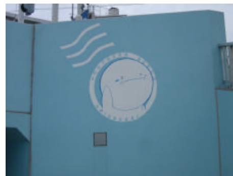
写真) 海岸への連絡道 (アンダーパス)