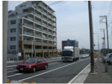
写真) 国道 134 号沿道に立地している建築物