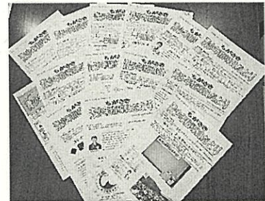
青少年指導員だより作成・発行