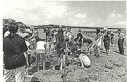
遊び体験教室の引率・見守り