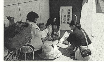
有害図書類回収 茅ヶ崎駅南口に回収ボックスを設置しています