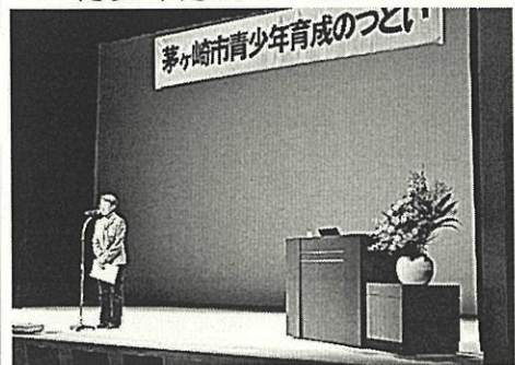
青少年育成のつどいの企画・運営