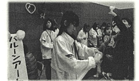
ちがさきスポーツ・レクリエーション フェスティバル