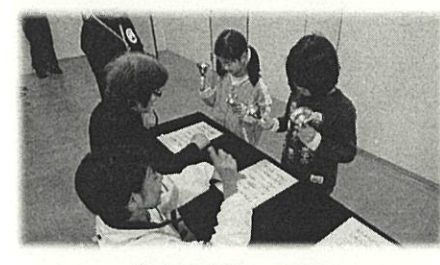
青少年会館フェスタ 子どもたちがミュージックベルを体験します