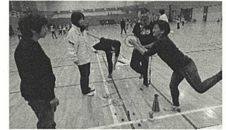
全体会 青少年指導員の交流を深める事業です