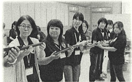
行政研修 青少年指導員としての資質向上をはかる研修です