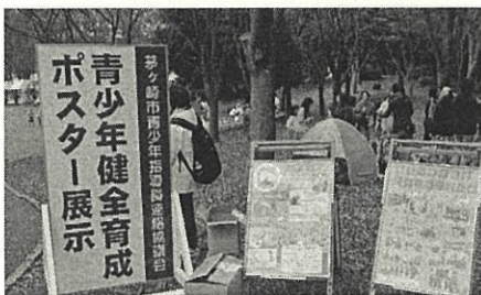
市民ふれあいまつり 青少年健全育成ポスター展示やバルーンアートの指導を行います