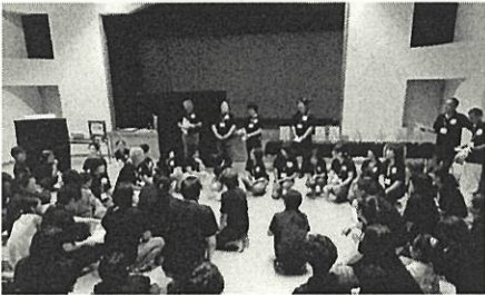
青少年指導員研修 各自のスキルアップのための研修会です