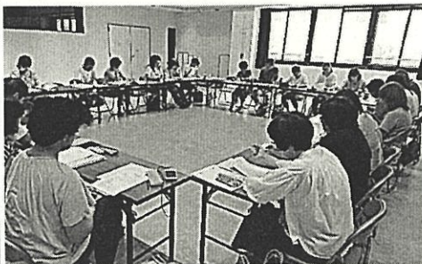
理事会での情報の共有