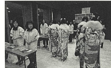
青少年育成のつどい 市からの委託により企画し開催しています