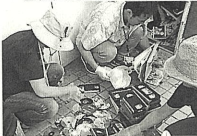
有害図書類の分別・回収