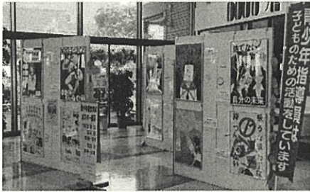
青少年健全育成ポスター展示 市立中学校の生徒がポスターを制作しています