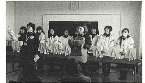
県立茅ヶ崎養護学校文化祭 〈きらめき祭〉