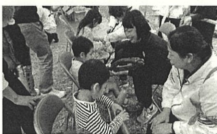
子ども会新役員研修会 新役員の方々に子ども向けゲームや備品を紹介します