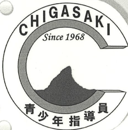
青少年指導員 ロゴマーク 50周年を記念して作成しました

市内19小学校区から5名ずつ、計95名が県と市から委嘱され、青少年の健全育成のために活動しています。