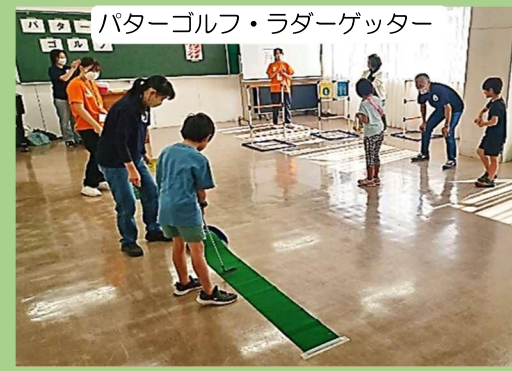
バターゴルフ・ラダーゲッター

工作ブースと遊びブースを設け、いろいろな体験をしてもらいました。子どもたちの真剣な姿や楽しそうな笑顔がたくさんあふれていました。茅ヶ崎市ジュニア・リーダーズ・クラブのジュニアリーダーも大活躍でした。