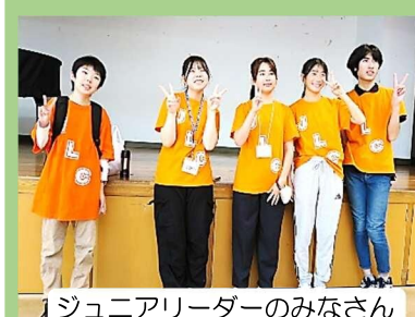
ジュニアリーダーのみなさん