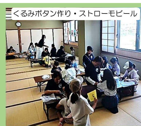
くるみボタン作り・ストローモビール