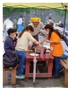
(ちがさき柳島キャンプ場にて)

▶参加希望の方は、「茅ヶ崎市青少年育成」で検索いただくか、青少年課にお問い合わせください。