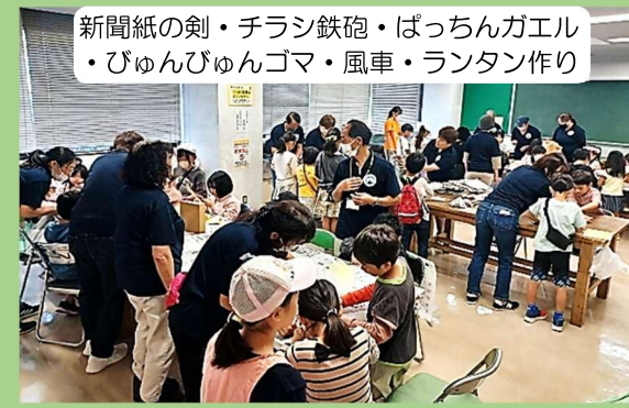
新聞紙の剣・チラシ鉄砲・ぱっちゃんガエル ・びゅんびゅんゴマ・風車・ランタン作り