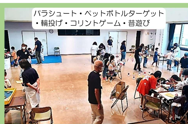
パラシュート・ペットボトルターゲット ・輪投げ・コリントゲーム・昔遊び