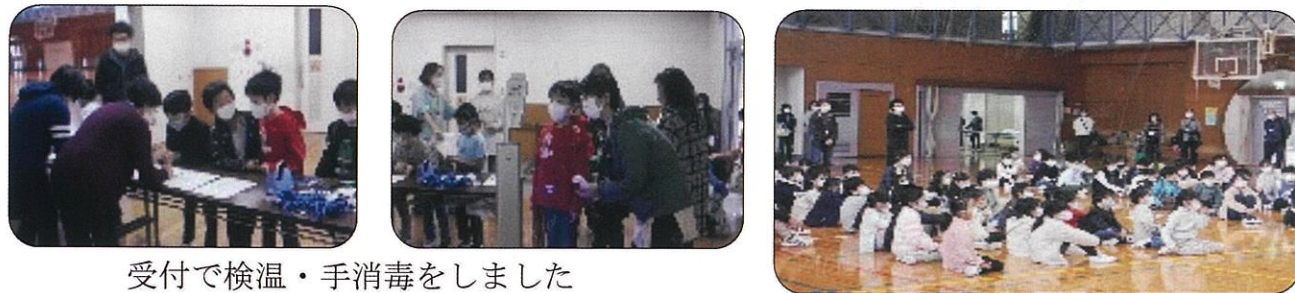
受付で検温・手消毒をしました

ランチルームでは、株式会社ULVAC（アルバック：茅ヶ崎市萩園）の方による「真空の中で、目覚まし時計の音はどうなる」「空気に重さはあるか」などの真空実験が行われました。ご協力いただきました皆さんありがとうございました。