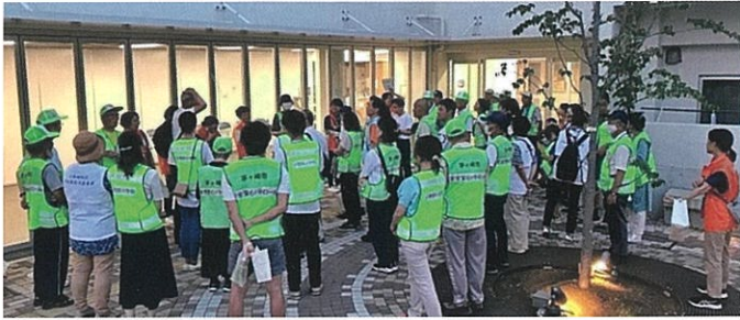
小和田複合施設のエントランスから、各コースへ出発!

夏休みの前半・後半で、子どもたちを見守る地域の皆さんと、小中学校の先生方と保護者有志が、一緒に通学路周辺の商店や公園を見回ります。今回は、小和田小学校南側にある小和田複合施設エントランス集合で、6コースのグループに分かれて実施。各コースとも最終チェックポイントで現地解散として、例年より帰宅時間も早くなりました。