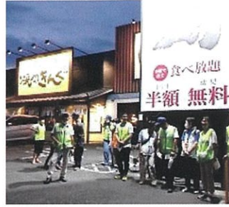
地域のパトロール隊(緑ベスト)と推進協役員(橙ベスト)