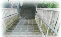
梅小前歩道橋に出ていた枝の剪定が行われました。