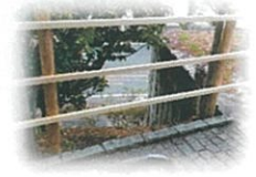
第一カッターきいろ公園（中央公園）ふれあい橋脇の柵が修理されました。