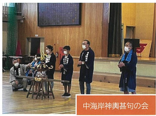
中海岸神輿甚句の会