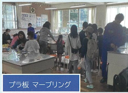
プラ板 マーブリング

今年のをんぱくまつりは、コロナ対策のため3部制を導入し、2会場に分けての開催となりました。茅ヶ崎小学校の児童、保護者360名に参加いただき、当日はたくさんの子どもの笑顔を見ることができました。一中生、中海岸子供会、地域のボランティアの皆さん、ありがとうございました。