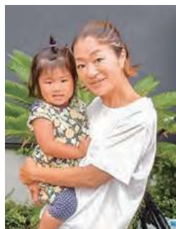
支援会員と依頼会員のお子さん▶