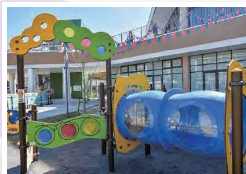
インクルーシブ遊具▲