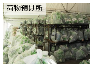
オフセット荷物袋

茅ヶ崎市内にある株式会社オーテックジャパン様には、自社の事務所・工場におけるエネルギー使用で排出されるCO 2 排出量をカーボン・オフセットするため、クレジットを17トンご活用いただきました。